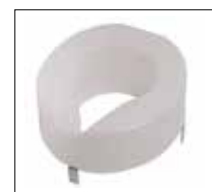
No. de modèle: 1636