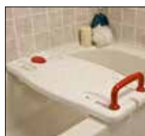
No. de modèle: 1495

Rembourrer en caoutchouc antidérapants améliorer la sécurité sans endommager la surface de la baignoire. Ses butées sont faciles à ajuster et s'adaptent sécuritairement à la très grande majorité des baignoires.