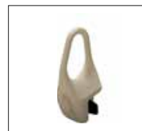
No. de modèle: 1265