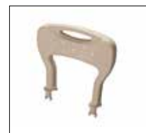
No. de modèle: 1417