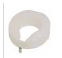
No. de modèle: 1634