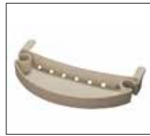
Part. no: 1418