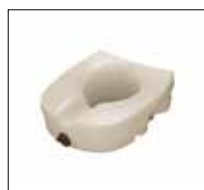
No. de modèle: 1640