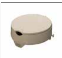
No. de modèle: 1665