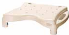
Select the seat