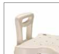
Poignée/petit dossier en option No. de modèle: 1416