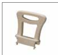
No. de modèle: 1416