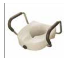
No. de modèle: 1645