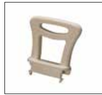
Part. no: 1416

These products are ideal in modifying your existing bathroom seating as your needs change. Use the small armrest as a short backrest on the small shower seat. Use the soap dish on either side of the large shower seat. The aluminum legs come in two sizes and fit any of the modular seats.