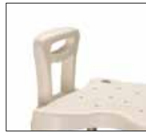
Optional armrest. Part. no: 1416