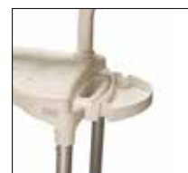
Porte-savon en option No. de modèle: 1418