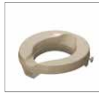
Part. no: 1662

Important facts: Injection moulded products are extremely durable and require ribs for added support. Because the plastic is injected into the mould at an extremely high pressure, these products are the most symmetrical and most uniform in design.