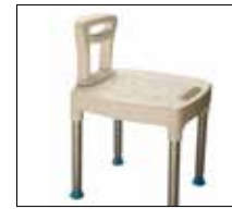
Small shower seat. Part. no: 1405