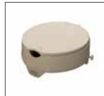
Part. no: 1665