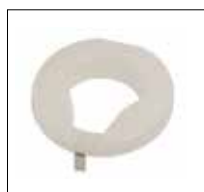
No. de modèle: 1632

Les sièges légèrement enveloppant sont formés pour répartir le poids d'un utilisateur sur une grande zone qui va non seulement aider à maintenir l'occupant en position, mais sera également suffisamment robuste pour faire face à l'utilisateur plus lourd. Une large ouverture frontale permet un accès facile pour le nettoyage personnel.