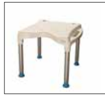
Large shower seat. Part. no: 1410