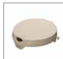
No. de modèle: 1663