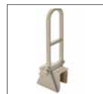
No. de modèle: 1255