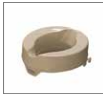
Part. no: 1664