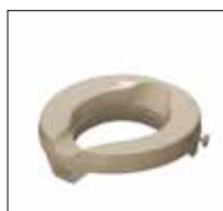
No. de modèle: 1662

Faits important : Produits moulé d'une seule pièce sont extrêmement durables et exigent des nervures pour un soutien supplémentaire. Parce que le plastique est injectée dans le moulé à une pression extrêmement élevée, ces produits sont le plus symétrique et plus uniforme dans la conception. En outre, cela crée un produit pratiquement incassable.