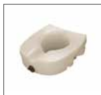
Part. no: 1640

Important facts Rotation moulded products are created when a detergent-like powder is poured into a mould, put into an extremely hot oven and spun very quickly in varying directions. The centrifugal force turns the powder into a liquid that coats the walls of the mould creating an extremely durable, uniform and hygienic product (there are no joints or seams to trap dirt and bacteria).