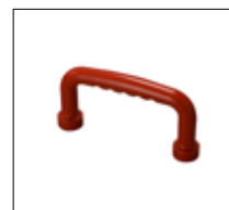
No. de modèle: 1463