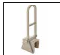
Part. no: 1255