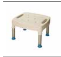
Bath Seat. Part. no: 1400

All pieces are manufactured with quality, durability and diversity in mind. These shower seats easily adjust in 1/2"/1.3cm increments to accommodate a variety of users. With an assortment of accessories, the possibilities change as your needs change.