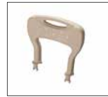
Part. no: 1417