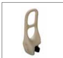
No. de modèle: 1260