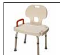
No. de modèle: 1465