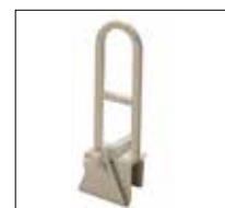
No. de modèle: 1250