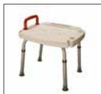
No. de modèle: 1460

Ils offrent également des supports à gauche et à droite pour déposer la douche à main, un siège en plastique moulé très solide et une poignée rouge en option qui peut être installée du côté désiré. Le modèle #1465 vient avec un dossier confortable.