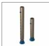
No. de modèle: 1419 [petit] 1420 [grand]