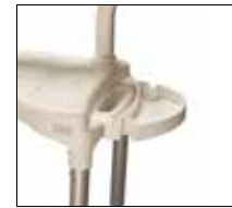
Optional soap dish. Part. no: 1418