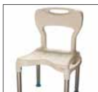
Grand siège de douche avec dossier No. de modèle: 1415