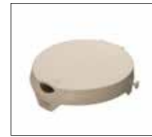
Part. no: 1663