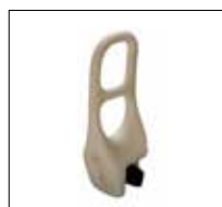
Part. no: 1260