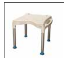
Grand siège de douche No. de modèle: 1410