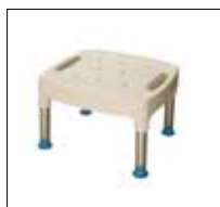
Siège de douche No. de modèle: 1400

Toutes les pièces sont fabriquées avec la qualité, la durabilité et la diversité à l'esprit. Ces sièges de douche s'adaptent facilement en 1/2po / 1,3cm incréments pour accueillir une variété d'utilisateurs. Avec un assortiment d'accessoires, les possibilités changent en fonction des besoins de changement de votre client.