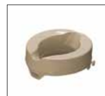
No. de modèle: 1664