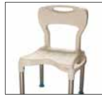
Large shower seat with backrest. Part. no: 1415