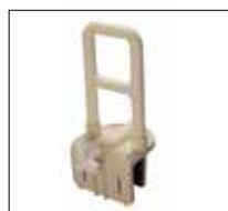
No. de modèle: 1240

Étonnamment facile à installer, les poignées d'appui pour baignoire en acier sont disponibles en une poudre attrayant finition enduit blanc et les rails de la baignoire en plastique dans un plastique résistant et léger qui fournit non seulement la stabilité, mais assure l'hygiène de leur construction étanche. Rembourrer en caoutchouc antidérapants protègent la paroi de la cuve et offrent une adhérence parfaite.