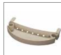
No. de modèle: 1418