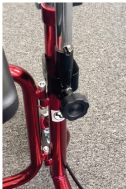
Montering av droppställning.