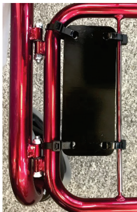
Placering av motvikter i rollatorns främre grind.

lossa det svarta vredet och skjuta upp det inre röret. Skruva fast vredet igen när önskad höjd är inställd. Säkerställ god stabilitet.